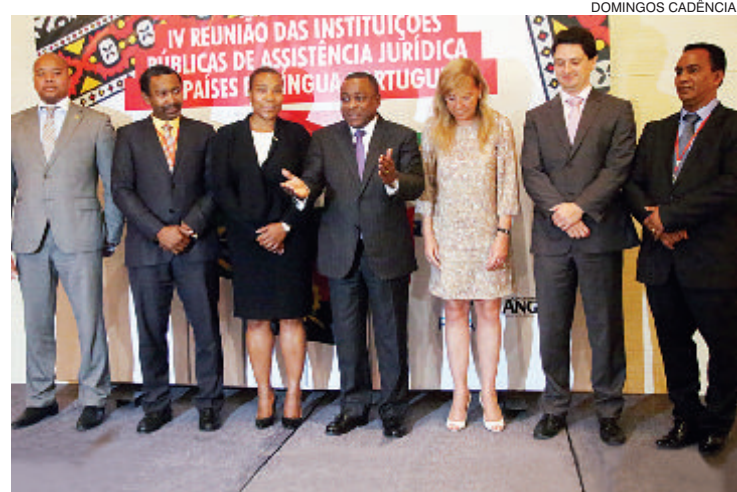
Ministros da Justiça da CPLP têm encontro alargado este mês na capital timorense

Robert Hillary King foi libertado em 2001, ao fim de 29 anos na solitária, depois de a sua condenação ter sido revogada. Herman Wallace foi libertado em Outubro de 2013 e morreu poucos dias depois, de cancro no fígado – passara a maior parte dos últimos 41 anos numa cela de 1,82 metros por 2,70 metros.