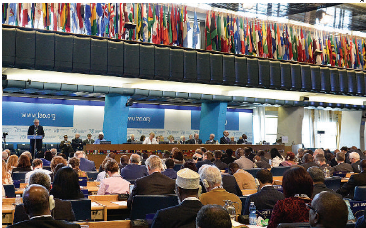
Conferência da ONU para a Alimentação e a Agricultura reconhece o trabalho desenvolvido pelo Governo de Angola no combate à fome

Angola, com outros 72 países, foi distinguida, no último domingo, com um diploma, por ter alcançado a meta de Desenvolvimento do Milénio, ao reduzir para metade a proporção de pessoas com fome e da Cimeira Mundial da Alimentação de 1996, ocasião em que os governos se comprometeram a reduzir para metade o número absoluto de pessoas subnutridas até 2015.